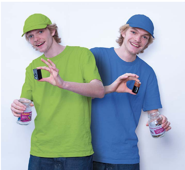
Bild ATM: Die Aufkleber für Batterien-Sammelgläser sind im Gemeindeamt und am Recyclinghof kostenlos erhältlich.

Knapp 40 % beträgt bereits der Lithium-Anteil bei den verkauften Batterien. Durch die richtige Sammlung werden nicht nur Brände verhindert, sondern wertvolle Rohstoffe wie Kobalt, Nickel, Mangan und Kupfer können recycelt werden.