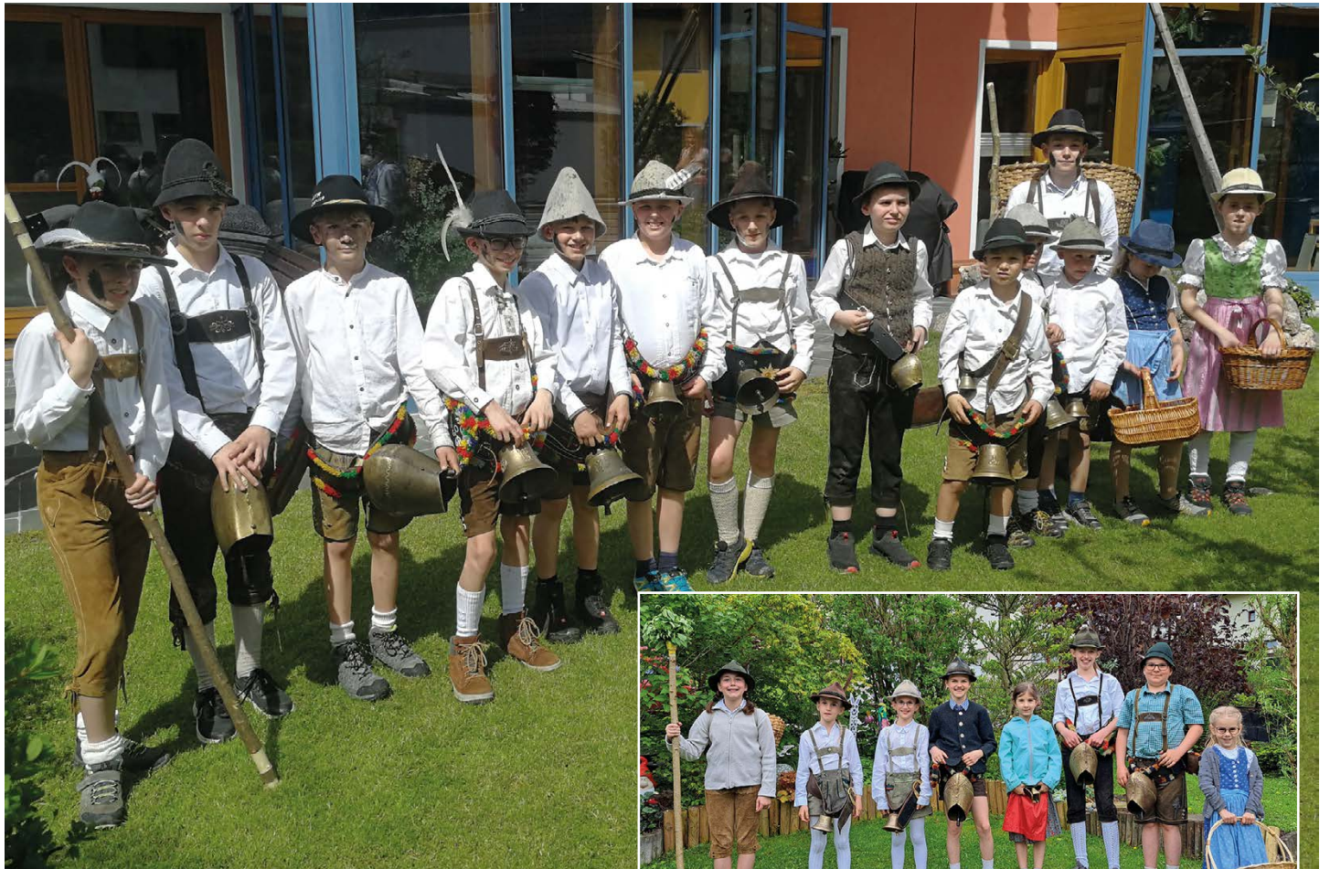
Kinder aus Strass und Rotholz Ende April unterwegs beim Grasausläuten.