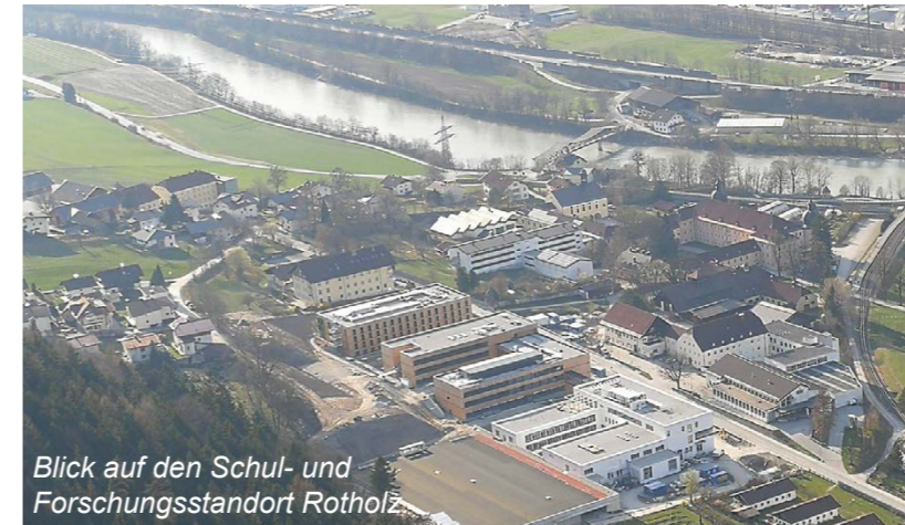
Blick auf den Schul- und Forschungsstandort Rotholz

Der kleine Wohnort Strass im Zillertal kann durch seine ideale geografische Lage mitten im unteren Inntal und direkt am Eingang ins Zillertal bzw. an der Auffahrt ins Achenal als großer Wirtschaftsstandort punkten. Mit 837 Beschäftigten in Strasser Unternehmen und Anstalten ziehen diese nahezu gleich mit der Anzahl der Bewohner:innen des Ortes.