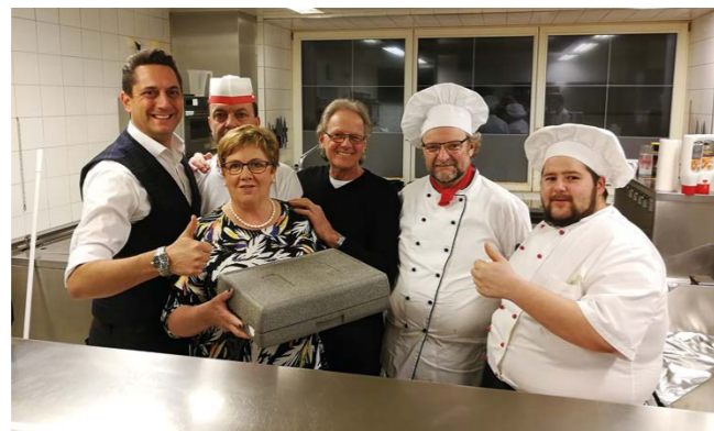
Essen auf Rädern: Frisch gekocht im Gasthof Post

Strass war lange der kleinste Sozialsprengel Tirols. Schon bald konnten Nächstenhilfe, Heilbehelfsverleih, Essen auf Rädern, Seniorenschwimmen, Erste-Hilfe-Kurse, Blutspenden, medizinische Vorträge und vieles mehr angeboten werden. Seit 1998 hatte man auch eigene Räumlichkeiten: In der neuen Volksschule Strass einen Büroraum (inzwischen Lagerraum der Gemeinde) und hinter dem Festsaal einen Heilbehelfsraum, der noch immer fleißig genutzt wird.