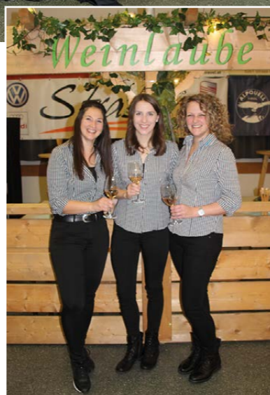
JB/LJ Strass im Zillertal

Wir sagen DANKE, für einen unvergesslichen Abend!