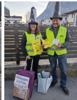
Der Kirchenchor versteht Spaß: Kegeln in Kramsach am Rosenmontag und Verkauf der Faschingszeitung am Faschingssamstag.